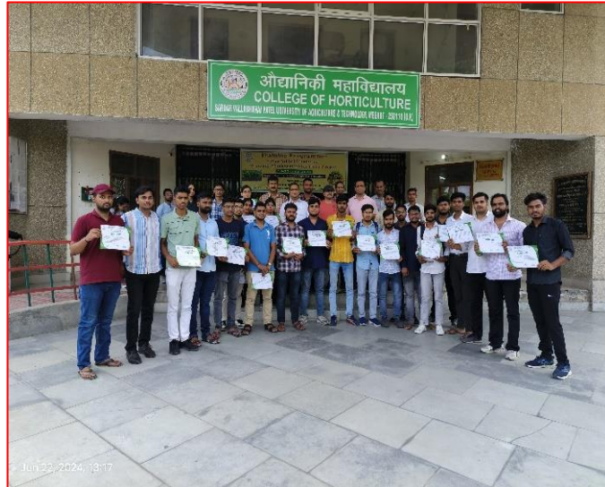
Jun 22, 2024, 13:17