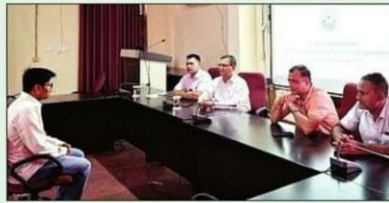
मॉक इंटरव्यू सेशन में छात्रों को साक्षात्कार की जानकारी देते शिक्षक। संवाद