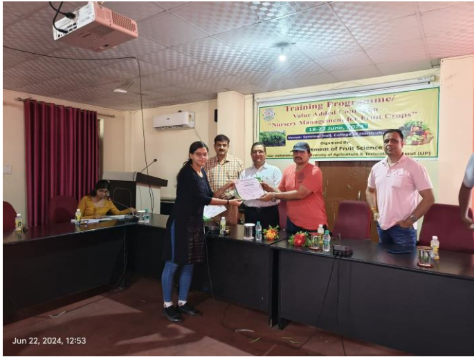
Jun 22, 2024, 12:53