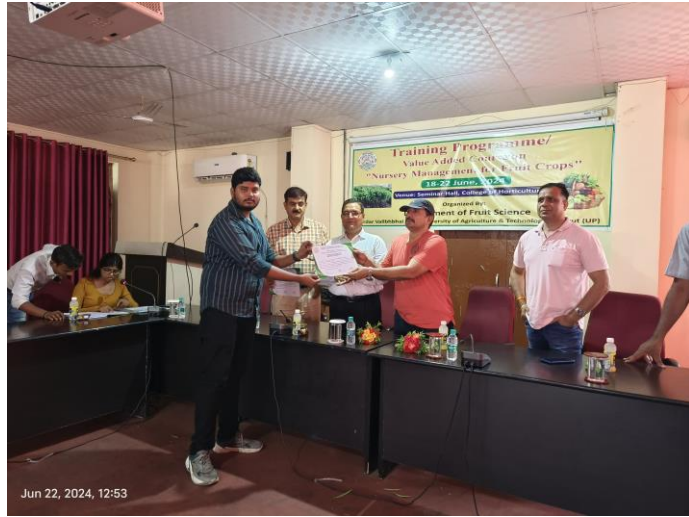
Jun 22, 2024, 12:53