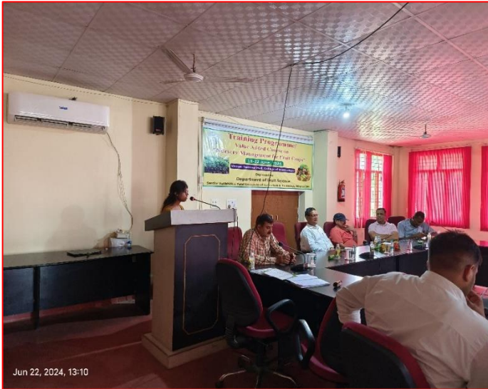
Jun 22, 2024, 13:10